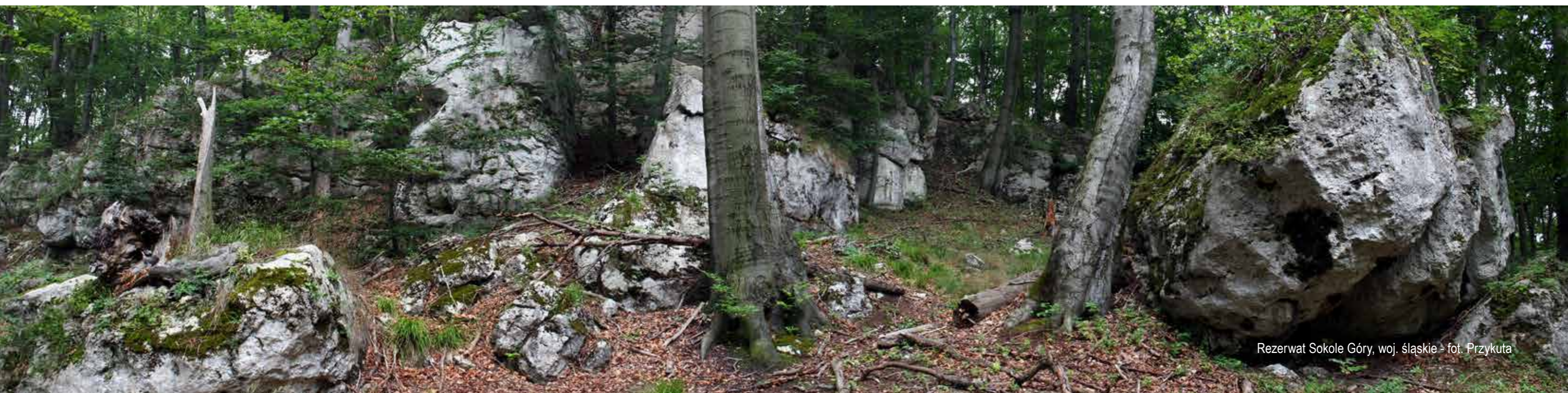
Rezerwat Sokole Góry, woj. śląskie

Korzystną formą realizacji projektów może być partnerstwo między administracją a organizacjami pozarządowymi – konieczna jest aktywna postawa obu stron, aby częściej dochodziło ono do skutku. Zachętą do takich działań może być zapewnienie dodatkowych punktów dla projektów realizowanych w partnerstwie w ramach procedur konkursowych.