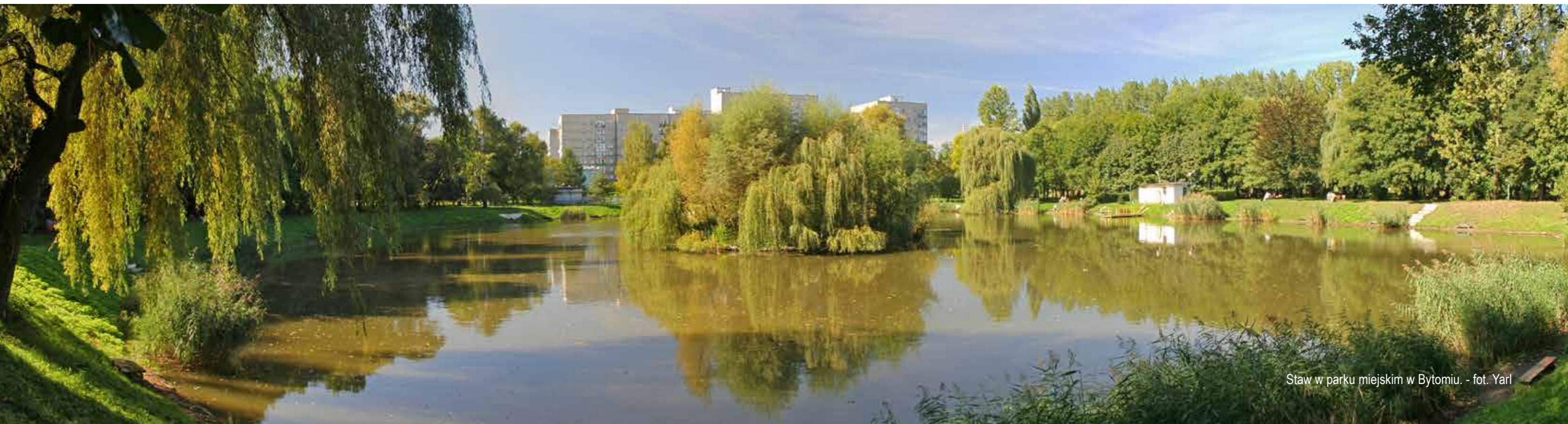
Staw w parku miejskim w Bytomiu.

W Programie przewiduje się również kontynuację inwestycji na rzecz uporządkowania gospodarki wodno-ściekowej województwa śląskiego. Dobrze, że w opisie tego działania znalazł się zapis wskazujący na możliwość wsparcia budowy systemów indywidualnych oczyszczania ścieków na terenach budowy rozproszonej. W wielu przypadkach może być to bardziej efektywne rozwiązanie niż budowa sieci kanalizacyjnej.