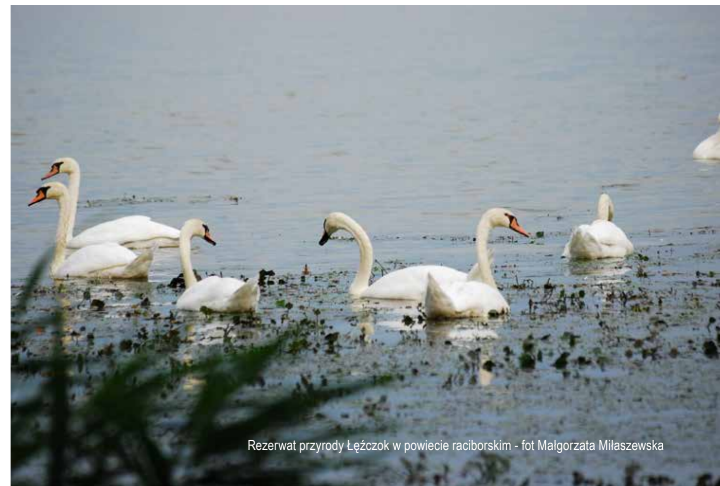
Rezerwat przyrody Łęczok w powiecie raciborskim

Warto zauważyć, że województwo śląskie jako pierwsze w kraju przyjęło regionalną strategię dotyczącą ochrony różnorodności biologicznej 3 . Świadczy to pozytywnie o świadomości ekologicznej władz samorządowych. Strategia ta wyznacza cztery cele strategiczne oraz przyporządkowane im kierunki działań, które zostały szczegółowo opisane w dokumencie. Znalazł się tam również rozdział dotyczący źródeł finansowania działań niezbędnych dla ochrony śląskiej przyrody, przy czym jednym ze wskazanych źródeł są środki Unii Europejskiej w ramach Europejskiego Funduszu Rozwoju Regionalnego.