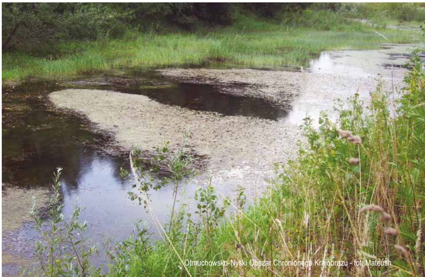
Otmuchowsko-Nyski Obszar Chronionego Krajobrazu

Znaczenie różnorodności biologicznej dla rozwoju regionu i potrzeba jej ochrony dostrzeżone zostały w części diagnostycznej projektu RPO WO 2014-2020, zgodnie z którą „do najważniejszych, środowiskowych uwarunkowań rozwojowych województwa zaliczyć należy m.in. znaczną bioróżnorodność i zróżnicowanie walorów przyrodniczo-krajobrazowych. Najcenniejsze obszary przyrodniczo-krajobrazowo-kulturowe stanowią nie tylko ważny element krajowego systemu ochrony przyrody, ale dzięki istniejącemu potencjałowi naturalnemu i kulturowemu stanowią poważny atut rozwoju gospodarczego regionu. Jednakże pomimo objęcia ochroną prawną ok. 30% powierzchni regionu odnotowywany jest ciągły spadek bioróżnorodności województwa, przejawiający się wysokim udziałem roślin naczyniowych, zbiorowisk roślinnych i fauny zagrożonych wyginięciem”.