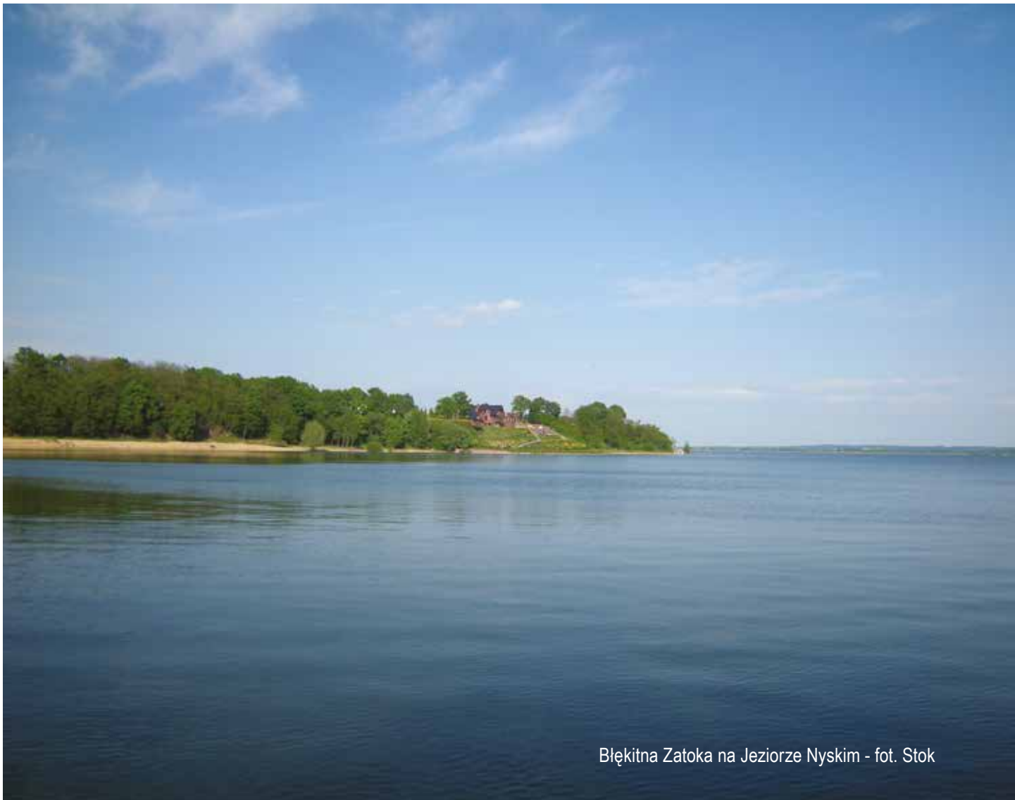
Błękitna Zatoka na Jeziorze Nyskim

W zakresie gospodarki odpadami, zgodnie z zapisami dokumentów unijnych i krajowych, przy wykorzystaniu środków unijnych przestrzegana powinna być hierarchia postępowania z odpadami, gdzie na pierwszy plan wysuwa się zapobieganie powstawaniu odpadów, ich ponowne wykorzystanie i przygotowanie do recyklingu. Obecny projekt RPO WO 2014-2020 wydaje się w zadowalający sposób wychodzić naprzeciw tym zasadom, podkreślając pierwszoplanowe znaczenie selektywnej zbiórki odpadów i potrzebę budowania „społeczeństwa recyklingu”. Hierarchia postępowania z odpadami musi jednak znaleźć odzwierciedlenie nie tylko w tekście RPO, ale na etapie wdrażania Programu i realizacji poszczególnych projektów.