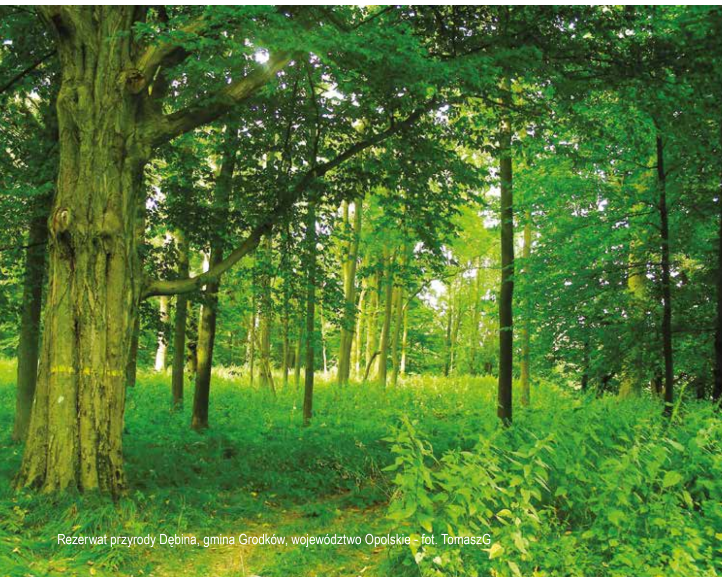
Rezerwat przyrody Dębina, gmina Grodków, województwo Opolskie

Z zadowoleniem należy przyjąć dostrzeżenie organizacji pozarządowych jako potencjalnych beneficjentów funduszy w ramach priorytetu inwestycyjnego 6.4, jak również umożliwienie realizacji kampanii edukacyjno-informacyjnych, które są niezbędne dla zapewnienia trwałego efektu ekologicznego działań z zakresu czynnej ochrony przyrody. Aby jednak środki te mogły być efektywnie wykorzystane, należy zwrócić uwagę na konieczność zapewnienia odpowiednich warunków wdrażania tego typu projektów, co omówiono w dalszej części stanowiska.