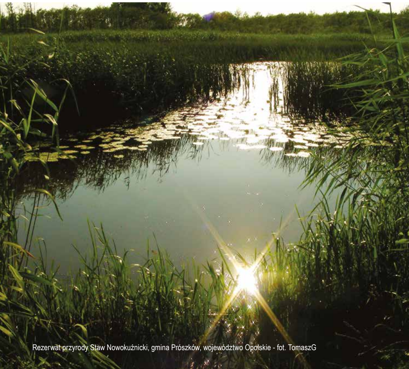
Rezerwat przyrody Staw Nowokuźnicki, gmina Prószków, województwo Opolskie

Celem stanowiska jest zapewnienie pełniejszej realizacji zasady zrównoważonego rozwoju w Regionalnym Programie Operacyjnym na lata 2014-2020. Stanowisko wypracowane zostało w oparciu o rekomendacje wypracowane podczas warsztatów dotyczących włączenia pozarządowych organizacji ekologicznych w proces programowania funduszy UE na poziomie regionalnym. Przy opracowaniu stanowiska wykorzystano również wyniki analizy dotyczącej Regionalnego Programu Operacyjnego na lata 2007-2013 w aspekcie zrównoważonego rozwoju oraz zawarte w analizie rekomendacje na kolejny okres. Adresatem stanowiska jest odpowiedzialny za przygotowanie RPO Urząd Marszałkowski oraz inni partnerzy zaangażowani w proces programowania - ma ono posłużyć jako punkt wyjściowy do debaty dotyczącej wykorzystania RPO w latach 2014-2020 dla rzeczywistej realizacji zrównoważonego rozwoju regionu.