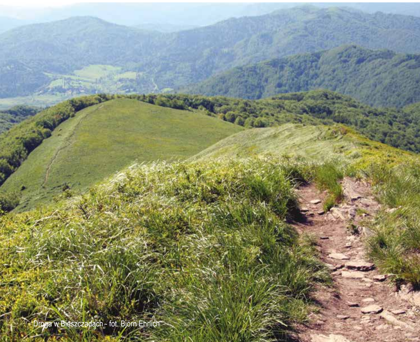
Droga w Bieszczadach

W dalszej części stanowiska zawarto szczegółowe rekomendacje odnoszące się do obszarów tematycznych szczególnie istotnych dla realizacji zasady zrównoważonego rozwoju w RPO WP 2014-2020.