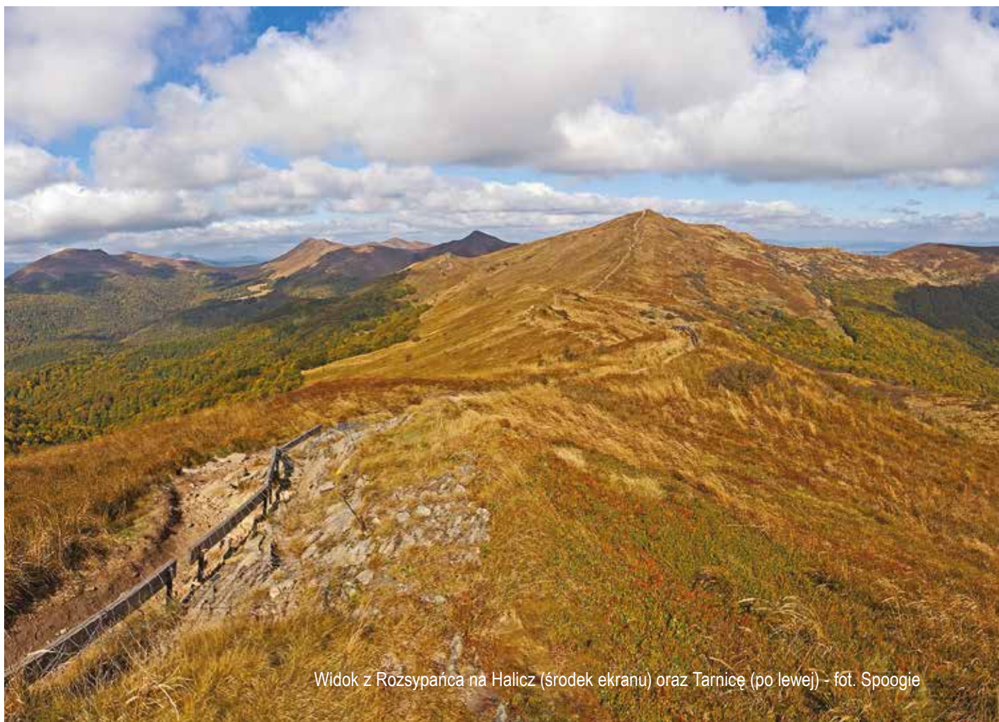
Widok z Rozsypańca na Halicz (środek ekranu) oraz Tarnicę (po lewej) - fot. Spooogie

Aktualne zapisy dotyczące efektywności energetycznej i OZE w projekcie RPO WP 2014-2020 są stosunkowo ogólne – zawierają szeroki katalog proponowanych działań, trudno jednak stwierdzić, na ile możliwe będzie ich wymierne wsparcie, co zależeć będzie od dostępnej alokacji środków. Na poparcie zasługuje stwierdzenie, że problem dostaw energii może być rozwiązany m.in. poprzez rozproszenie źródeł energii, w szczególności poprzez wprowadzenie odnawialnych źródeł energii jako alternatywy dla budowy elektrowni konwencjonalnych i konieczności rozbudowy sieci przesyłowych. Zadeklarowane w ten sposób dążenie do większej samowystarczalności energetycznej Podkarpacia w oparciu o energetykę rozproszoną, przede wszystkim bazującą na źródłach odnawialnych, powinno znaleźć mocniejsze odzwierciedlenie w kolejnej wersji RPO WP 2014-2020 oraz w uszczegółowieniu Programu.