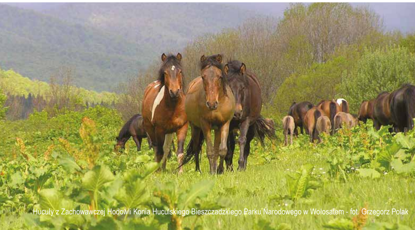
Hucule z Zachowawczej Hodowli Konia Huculskiego Bieszczadzkiego Parku Narodowego w Wołosatem

Obok zagwarantowania znacząco większej niż w okresie 2007-2013 alokacji funduszy na ochronę różnorodności biologicznej, niezbędne jest zaprojektowanie odpowiednich warunków realizacji tego typu projektów, aby dostępne środki mogły być efektywnie wykorzystane. W szczególności należy zapewnić odpowiednie warunki do korzystania z tych środków organizacjom pozarządowym, które mogą być efektywnym beneficjentem funduszy unijnych w ramach projektów przyrodniczych. Obok ogólnych rekomendacji zawartych w ostatniej części niniejszego stanowiska, w tym miejscu należy wspomnieć o konieczności umożliwienia finansowania tzw. wkładu własnego w projektach przyrodniczych ze środków WFOŚiGW, w sposób systemowy. RPO WP 2014-2020 musi zapewnić możliwość realizacji pełnego cyklu związanego z projektem przyrodniczym, włączając w to inwentaryzacje przyrodnicze oraz monitoring efektów zrealizowanych działań.