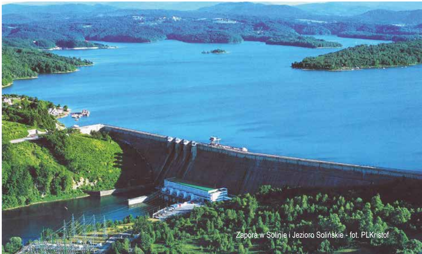
Zapora w Solinie i Jezioro Solińskie

Edukacja ekologiczna powinna być samodzielnym działaniem, finansowanym także ze środków Europejskiego Funduszu Społecznego, których znaczną częścią w okresie 2014-2020 dysponować będą samorządy wojewódzkie w ramach RPO. Możliwość ta wydaje się dostrzeżona w projekcie RPO WP 2014-2020, gdzie jednym ze wskaźników w działaniu 8.2 „Upowszechnienie uczenia się dorosłych” jest liczba osób objętych działaniami w zakresie edukacji ekologicznej. Kolejny projekt RPO WP 2014-2020 powinien zawierać mocniejsze uwzględnienie obszaru edukacji ekologicznej zarówno w osi priorytetowej „Czysta energia i środowisko”, jak i w osiach priorytetowych finansowanych z EFS.