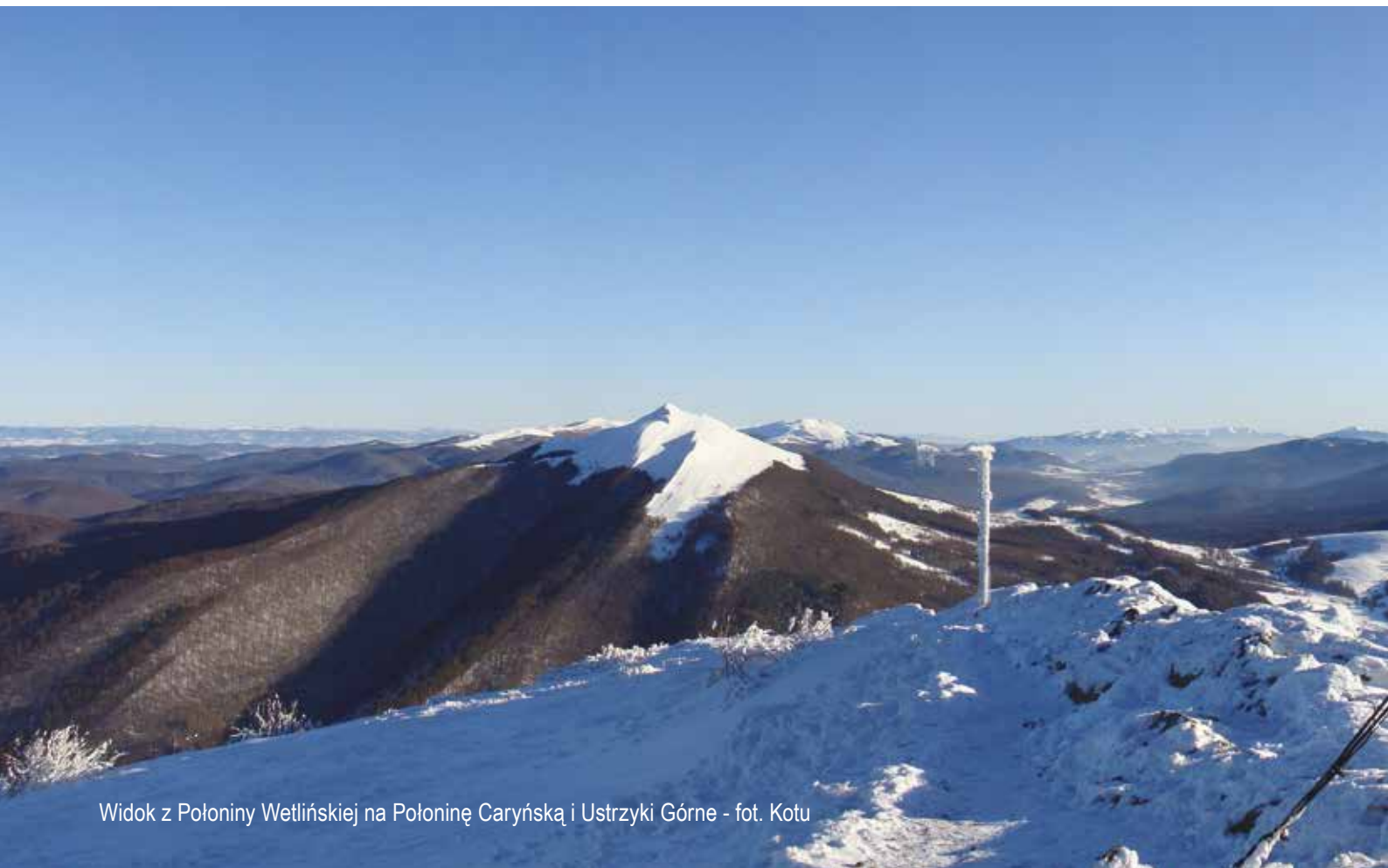
Widok z Połoniny Wetlińskiej na Połoninę Caryńską i Ustrzyki Górne

W ramach RPO WP 2014-2020 należy zapewnić finansowanie dla rewitalizacji i modernizacji najważniejszych dla regionu linii kolejowych, które nie będą objęte wsparciem z poziomu krajowego. Szczególną uwagę należy poświęcić liniom kolejowym zapewniającym dojazdy pasażerskie do głównych miast, jak również w tereny atrakcyjne turystycznie. Równie istotne jest zapewnienie warunków dla funkcjonowania kolejowych przewozów towarowych. Mając na uwadze wysokie koszty zewnętrzne samochodowego transportu towarów (niszczenie nawierzchni dróg, zanieczyszczenie powietrza, hałas, kongestia, wypadki) powinien być to priorytet w skali kraju, ale również, w komplementarny sposób, działanie wspierane w ramach RPO WP 2014-2020.