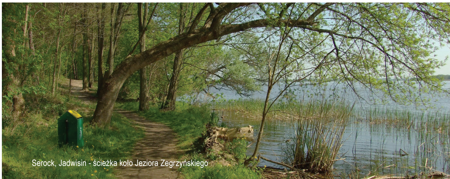
Serock, Jadwisin - ścieżka koło Jeziora Zegrzyńskiego

Dodatkowo, postulujemy, by w ramach celu szczegółowego dotyczącego rewitalizacji i rekultywacji zdegradowanej przestrzeni miejskiej oraz poprawy stanu środowiska zaplanować wsparcie dla ochrony różnorodności biologicznej poprzez przywracanie na cele przyrodnicze terenów zdegradowanych (np. tworzenie terenów zielonych, parków miejskich).