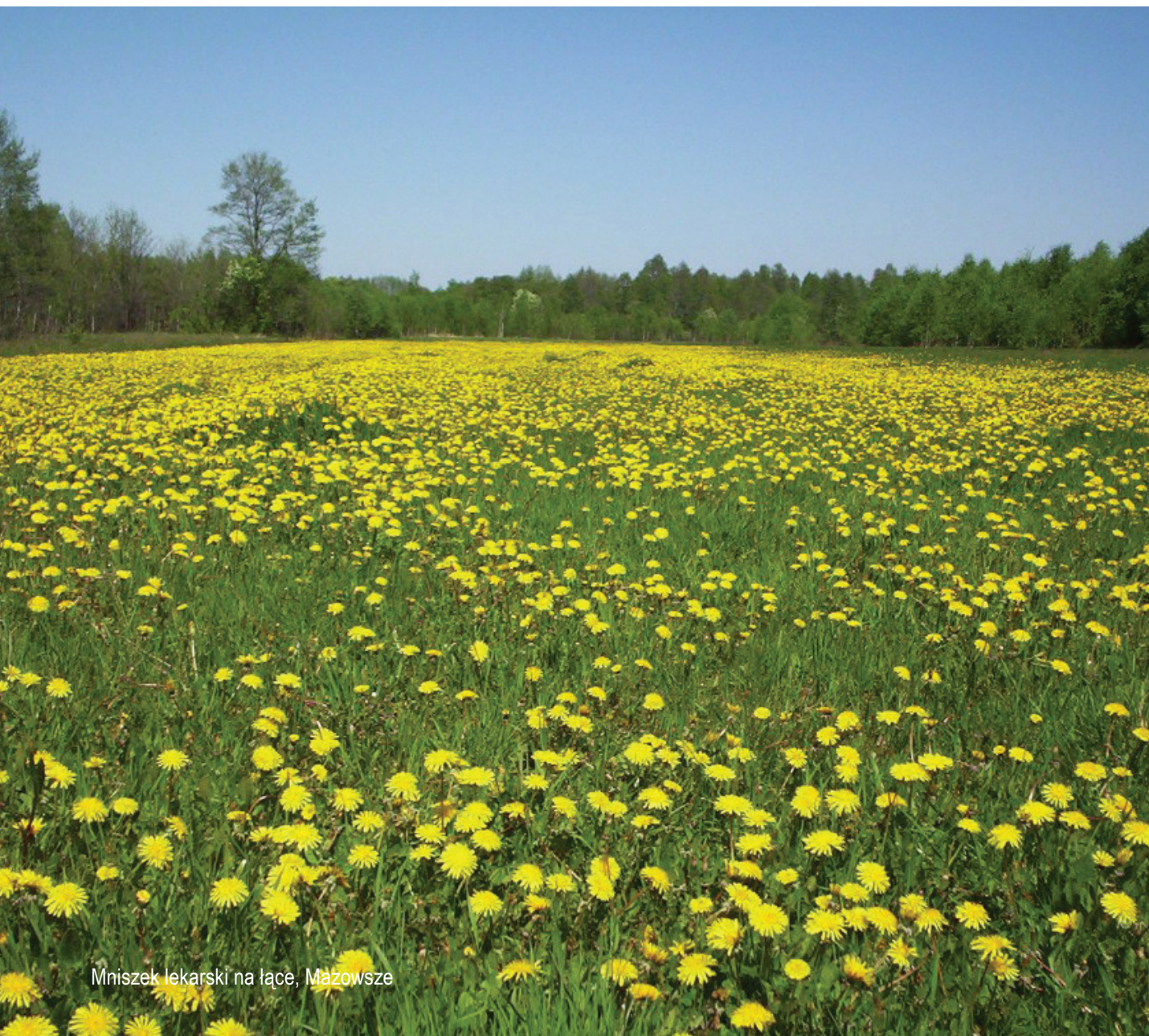
Mniszek lekarski na łące, Mazowsze

Celem stanowiska jest zapewnienie pełniejszej realizacji zasady zrównoważonego rozwoju w Regionalnym Programie Operacyjnym na lata 2014-2020. Stanowisko wypracowane zostało w oparciu o rekomendacje wypracowane podczas warsztatów dotyczących włączenia pozarządowych organizacji ekologicznych w proces programowania funduszy UE na poziomie regionalnym. Przy opracowaniu stanowiska wykorzystano również wyniki analizy dotyczącej Regionalnego Programu Operacyjnego na lata 2007-2013 w aspekcie zrównoważonego rozwoju oraz zawarte w analizie rekomendacje na kolejny okres. Adresatem stanowiska jest odpowiedzialny za przygotowanie RPO Urząd Marszałkowski oraz inni partnerzy zaangażowani w proces programowania - ma ono posłużyć jako punkt wyjściowy do debaty dotyczącej wykorzystania RPO w latach 2014-2020 dla rzeczywistej realizacji zrównoważonego rozwoju regionu.