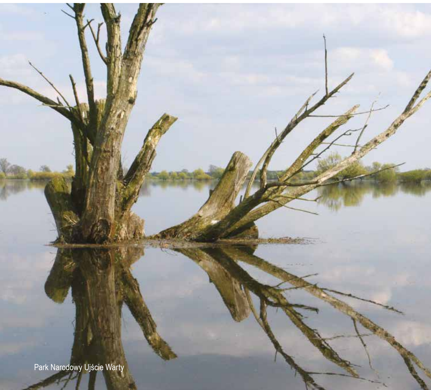
Park Narodowy Ujście Warty

Celem stanowiska jest zapewnienie pełniejszej realizacji zasady zrównoważonego rozwoju w Regionalnym Programie Operacyjnym na lata 2014-2020. Stanowisko wypracowane zostało w oparciu o rekomendacje wypracowane podczas warsztatów dotyczących włączenia pozarządowych organizacji ekologicznych w proces programowania funduszy UE na poziomie regionalnym. Przy opracowaniu stanowiska wykorzystano również wyniki analizy dotyczącej Regionalnego Programu Operacyjnego na lata 2007-2013 w aspekcie zrównoważonego rozwoju oraz zawarte w analizie rekomendacje na kolejny okres. Adresatem stanowiska jest odpowiedzialny za przygotowanie RPO Urząd Marszałkowski oraz inni partnerzy zaangażowani w proces programowania - ma ono posłużyć jako punkt wyjściowy do debaty dotyczącej wykorzystania RPO w latach 2014-2020 dla rzeczywistej realizacji zrównoważonego rozwoju regionu.