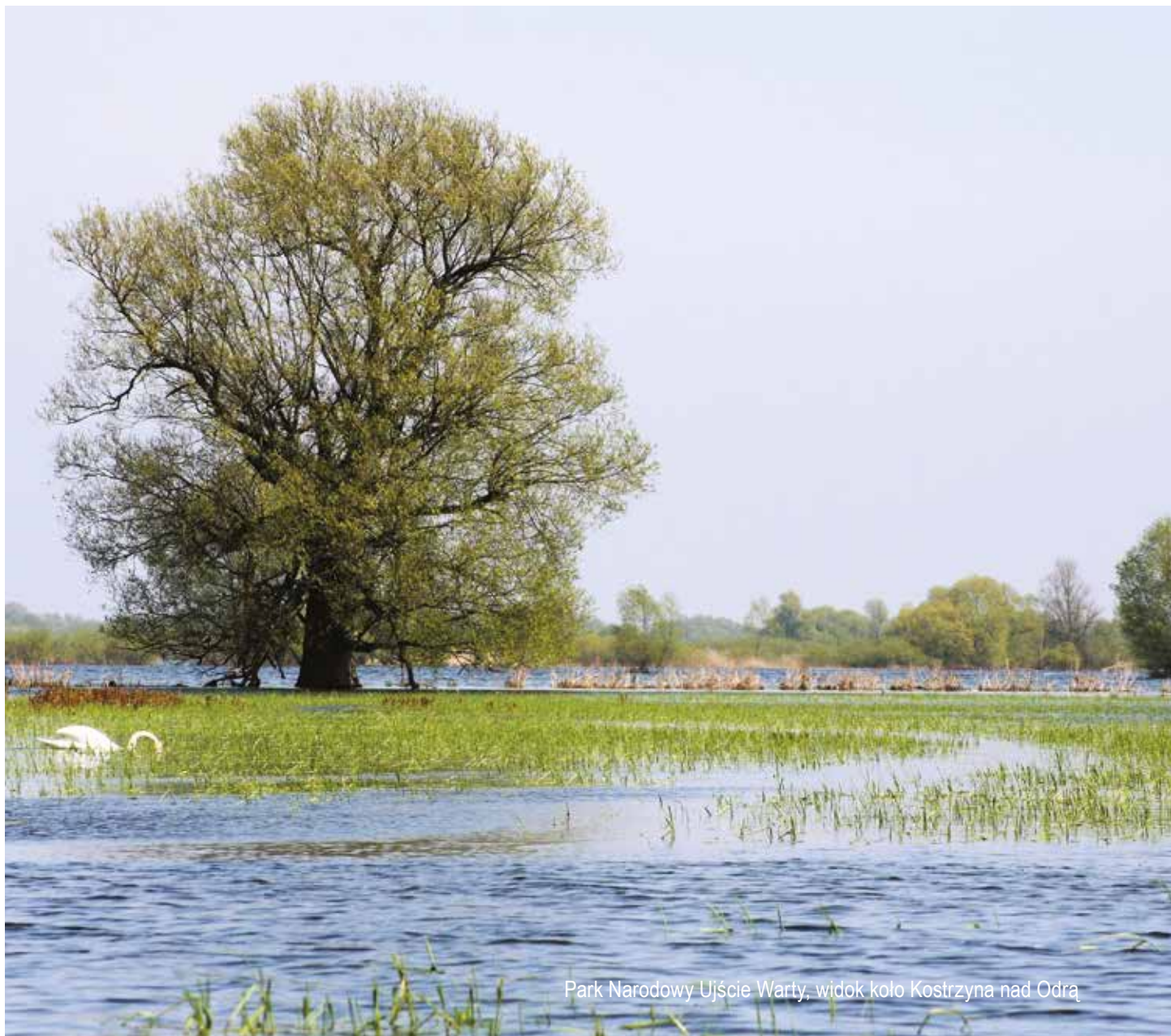
Park Narodowy Ujście Warty, widok koło Kostrzyna nad Odrą

Realizacja zasady zrównoważonego rozwoju na wszystkich poziomach wdrażania RPO WL nie będzie naszym zdaniem możliwa bez działań edukacyjnych i rozwijających kompetencje w aspekcie środowiskowym.