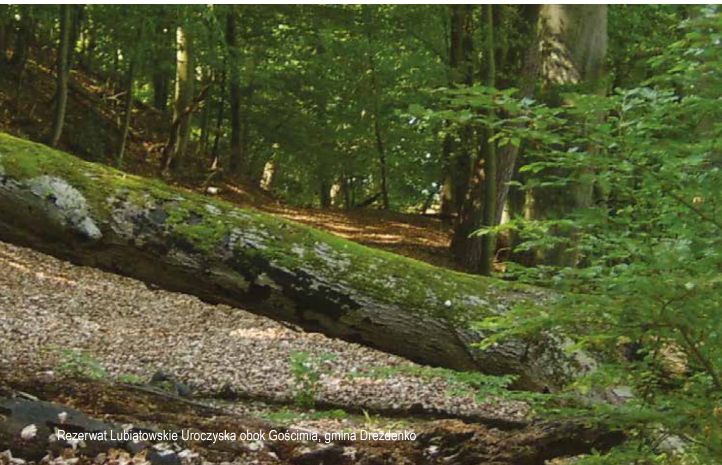
Rezerwat Lubiątkowskie Uroczyska obok Gościmia, gmina Drezdenko