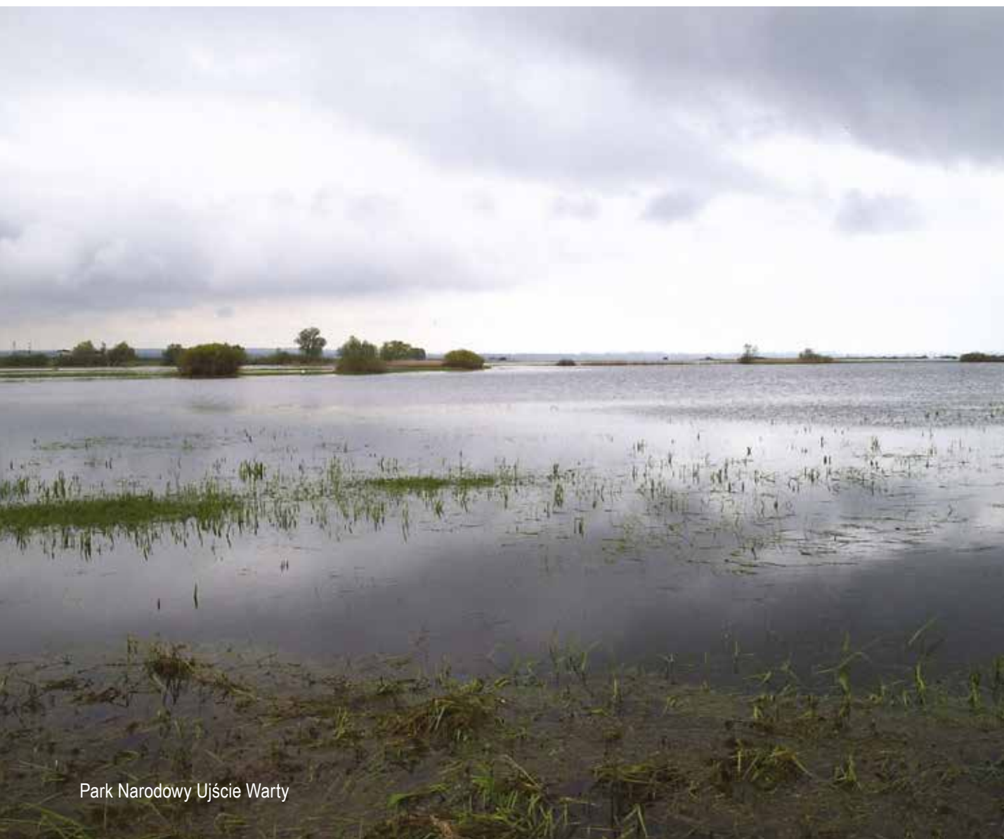
Park Narodowy Ujście Warty

Zdaniem organizacji pozarządowych ochrona przyrody powinna być równorzędnym działaniem w ramach nowego RPO, a jej wdrażanie powinno zostać zabezpieczone przez dostęp różnych typów beneficjentów i redefinicję typów działań. Postulujemy też uprzednie rozpoznanie potrzeb i uwarunkowań w regionie w tym zakresie.