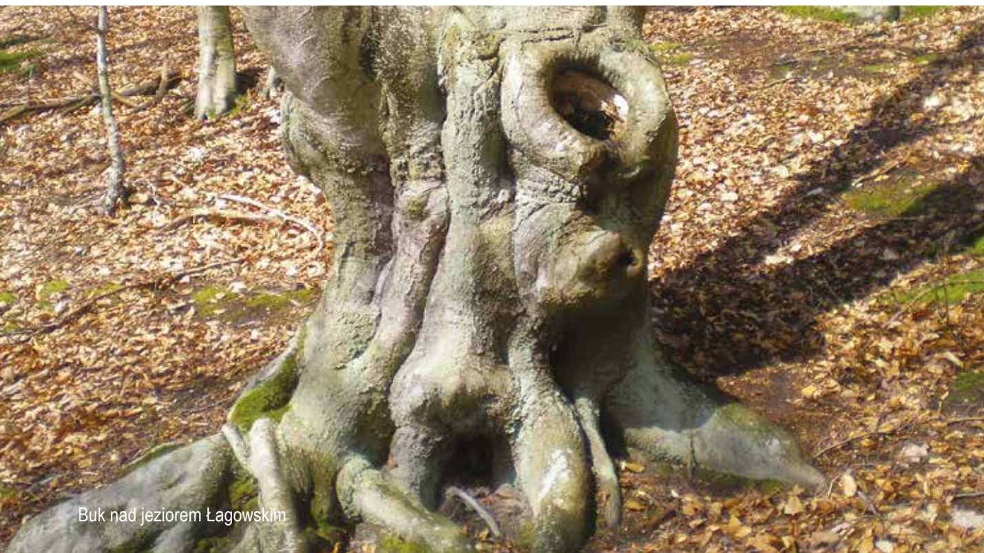
Buk nad jeziorem Łagowskim